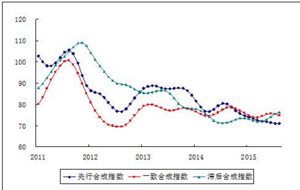
图 3 中经有色金属产业合成指数曲线

在构成有色金属产业先行指数的 7 个指标中，4 个指标同比回落，3 个指标同比上升。其中 LME 指数、汽车产量、有色金属固定资产投资额和进口额的同比降幅分别为 17.9%、9.7%、12.4%和 6.2%； M1、商品房销售面积和家电产量同比增幅分别为 6.3%、17.5%和 2.1%。